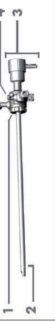
Figura: trocater para artroscopia e as duas torneiras

Indicação Este instrumento foi designado para utilização em cirurgias minimamente invasivas e, particularmente, em artroscopia.